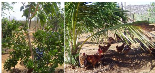
Figura 3. Fruteiras em consórcio com a criação de galinhas na comunidade Lindolpho Silva.

Dados levantados junto à presidente da comunidade Lindolpho Silva, indicam que há na comunidade um total de 1200 aves, entre corte e postura, criadas em consórcio com os quintais produtivos (Figura 3). As aves de corte são comercializadas entre 90 e 120 dias, em feiras locais e junto ao PAA, o qual garante anualmente a compra de 5.000 reais por família, o retorno rápido da venda vem motivando a criação de aves na comunidade, ao contrário da tradicional criação de caprinos, cujo retorno financeiro demora entre 1,5 a 2 anos.