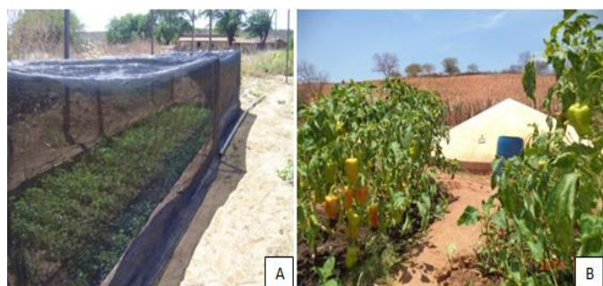
Figura 4. Cultivo de coentro e pimentão presentes nas comunidades Baixa da Boa Vista (A) e Campo Verde (B).

Cabe ressaltar que também é comum o plantio de ervas medicinais para o uso da família, como o alecrim ( Rosmarinus officinalis ), malva ( Malva sylvestris ), romã ( Punica granatum ), entre outras, irrigados com água da cisterna. Foi observado em algumas famílias, o uso de palhas de palmeiras e/ou sombrite para amenizar o sol sobre os canteiros de hortaliças (Figura 4).