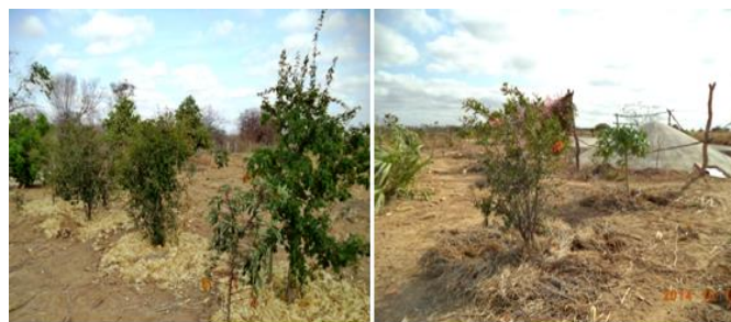
Figura 5. Cobertura morta usada nas fruteiras.

De modo geral, em todas as comunidades visitadas não são utilizados defensivos agrícolas nas culturas, adotando-se apenas práticas de bases agroecológicas em suas atividades agropecuárias, tais como cobertura morta (Figura 5) e adubação com esterco de aves e de pequenos ruminantes. Além de promoverem melhor nutrição às plantas, redução das perdas de umidade do solo por evaporação e aumento da conservação dos recursos naturais, tais práticas contribuem com a melhor qualidade de vida, pela produção e consumo de alimentos saudáveis.