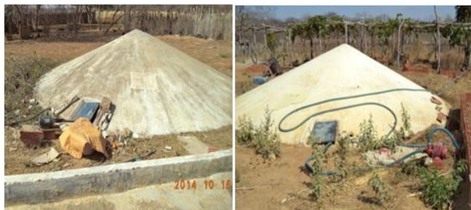
Figura 6. Uso de bomba para retirada de água nas cisternas.