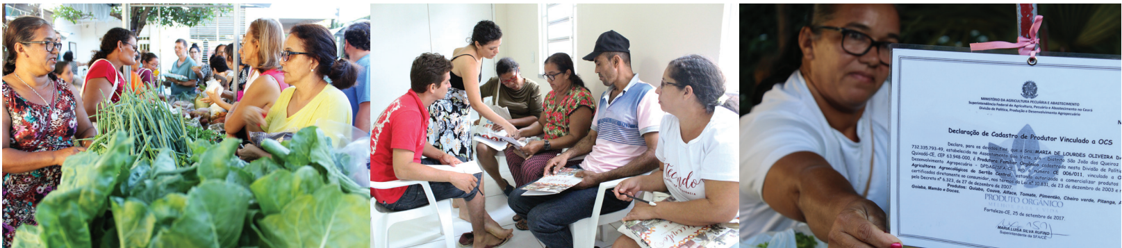
Feira Agroecológica e Solidária de Fortaleza | Oficina sobre Qualidade dos Alimentos | Declaração de Cadastro de Produtor/a Vinculado a OCS

Para o CETRA, a Rede de Feiras fortalece a dimensão política dos processos de organização e comercialização das agricultoras e agricultores. A auto-organização dos/as agricultores/as em torno de práticas da economia solidária, da produção de alimentos para a segurança alimentar e nutricional e a busca por autonomia refletem a resistência desses sujeitos frente à padronização do seu patrimônio alimentar e modos de vida. Nesse espaço de diálogo são pautados tanto a qualificação do processo de comercialização quanto o acesso as políticas públicas e as formas de como aproximar um maior número de pessoas aos alimentos agroecológicos no campo e na cidade.